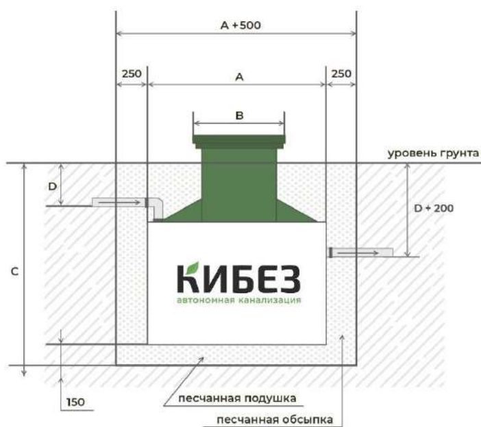
Схема подготовки котлована